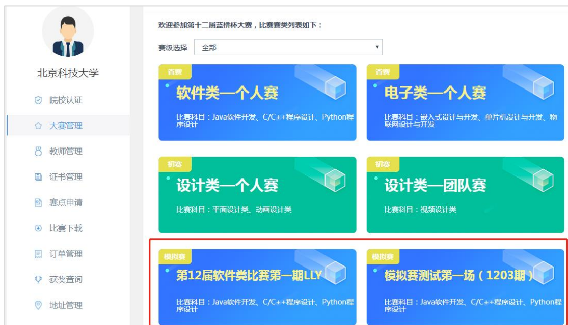
1.19 院校【大赛管理】中选择软件赛模拟赛

软件赛模拟赛需学校统一组织报名、考试。院校如果需要申请参加蓝桥杯软件赛模拟赛考试，首先，需要登录蓝桥杯大赛报名系统进行注册并完成认证。后台认证通过后，院校可以在个人中心【大赛管理】栏目，选择软件赛模拟赛中的某场比赛，点击进入模拟赛考试申请页面。