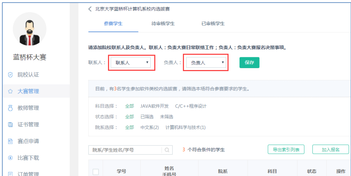
1.23 添加联系人、负责人

院校管理员需要对报名本校模拟赛的学生进行筛选。院校创建完成某场模拟赛，点击进入【参赛学生列表】页面，可以看到本校所有报名的符合本场考试的学生列表。院校需要添加本场考试的院校联系人、负责人，方便组委会联系。