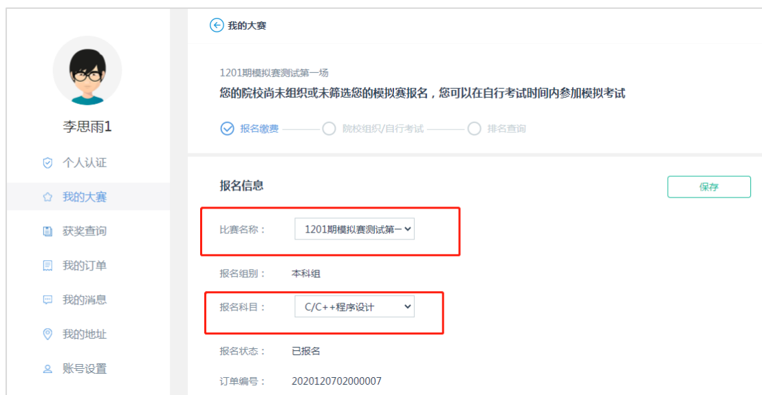
1.7 院校未筛选前，可以修改报名信息