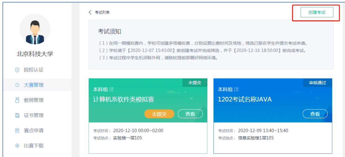
1.20 点击【创建考试】按钮，创建模拟赛考试