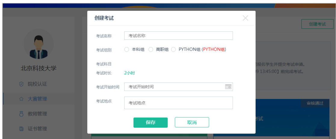
1.21 填写模拟赛的考试信息

需要说明的是，院校可以创建多场软件赛模拟赛，每场模拟赛需要分别筛选学生，筛选完成后提交后台系统审核。如果同一时间段参赛院校人数超过最大限额，将无法通过系统审核。院校可以修改考试时间后重新提交。