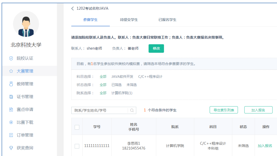
1.24 筛选学生并加入报名

院校筛选完成后，需要将考试信息提交后台系统审核。另外，未提交审核前，可以通过【编辑】按钮进行考试信息的修改。