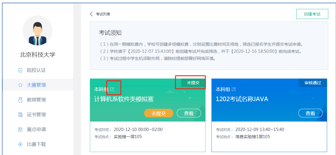
1.22 院校创建的模拟赛考试列表